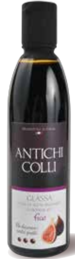
Figue 250 ml : Ideale su formaggi e carni rosse Perfect on fresh cheeses and red meat Idéal sur du fromage frais et de la viande rouge

Grazie alla sua elevata densità è ideale per decorare i piatti della cucina innovatrice stimolando l'inventiva dello chef. Il suo sapore evoca fedelmente quello dell'aceto balsamico originale e consente molteplici abbinamenti gastronomici.