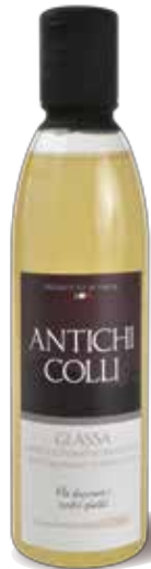
Condiment Blanc 250 ml : Ideale su carni bianche e pesce Perfect on white meat and fish Idéal avec de la viande blanche et poisson