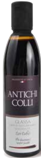
Truffe 250 ml : Ideale su formaggi stagionati, soufflé di riso e pane all'olio Perfect with ripened cheeses, rice soufflé and roasted bread with olive oil. Idéal sur fromages, riz soufflé, pain grillé avec huile d'olive.