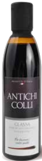
Classic 250 ml - 500 ml : Ideale su insalate e grigliate Perfect on salads, grilled meats or French fries Parfait sur des salades, viandes grillées ou frites.