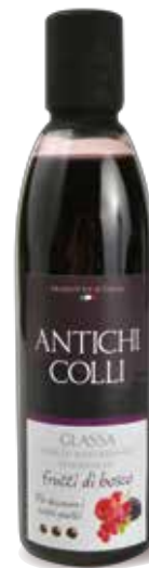
Fruits des bois 250 ml : Ideale su macedonie di frutta e dessert Perfect on fruit salad and dessert. Idéal dans une salade de fruit et des desserts.